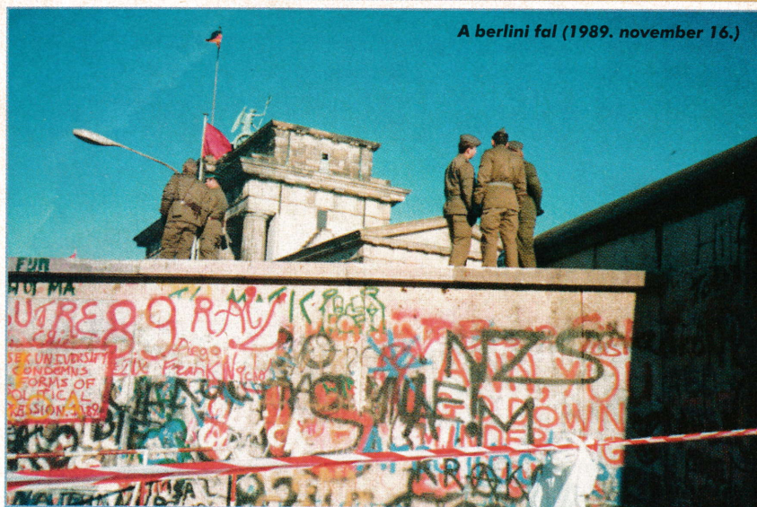
A berlini fal (1989. november 16.)