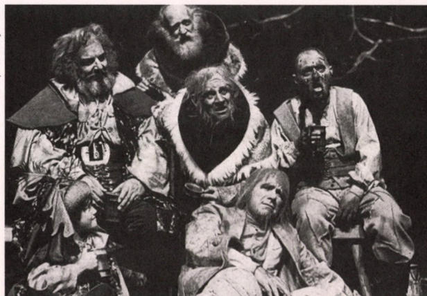
Falstafs ar biedriem "Henrija IV" 2. daļas uzvedumā Šekspīra Piemiņas teātrī, 1975